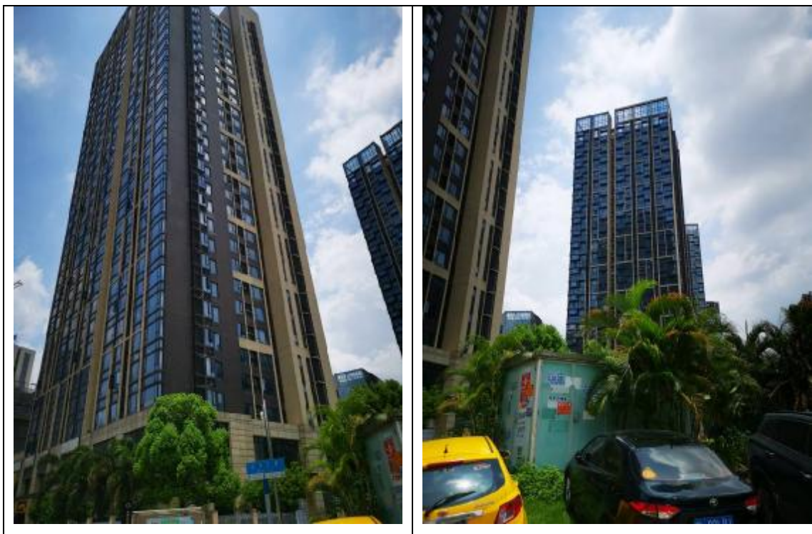
图1.1-1 部分建筑物现状图