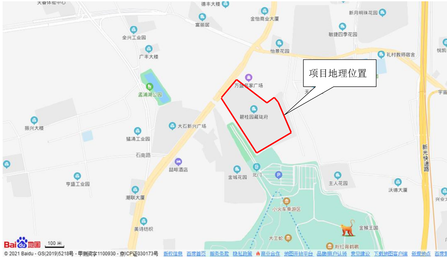
附图1、项目地理位置图