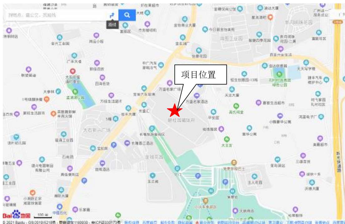
图1.1-2 项目区地理位置图